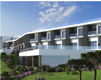
Hôtel Royal Obidos *****