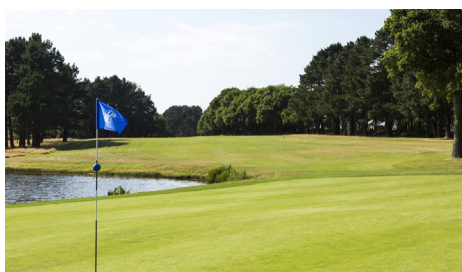
Parcours Diane Barrière-Desseigne