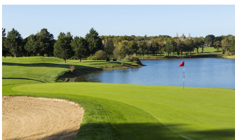
Parcours Lucien Barrière