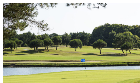
Parcours Diane Barrière-Desseigne

À 8kms du bord de mer, en plein coeur de Parc Naturel Régional de Brière, le Golf International Barrière 3 parcours, 45 trous, est un havre de paix pour les golfeurs et les amoureux de la nature.